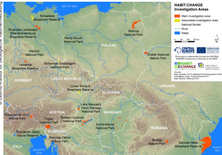
Die Pilotregionen verteilen sich über den gesamten mittel- und osteuropäischen Raum.